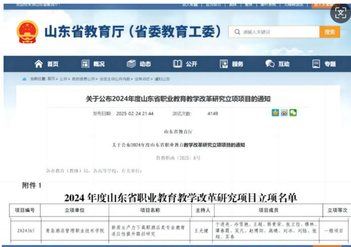
图 9 海尔洲际酒店参与职业教育教学改革成果立项

酒店与学校联合构建“校企双元、专兼结合”的教学团队，以学校教师为主导，企业导师为辅助，开展集体备课、教学观摩、集体研讨教学内容优化、教学方法创新等问题，推动教学内容精准对接岗位需求，研讨成果进一步提炼，立项 2024 年度山东省职业教育教学改革课题。