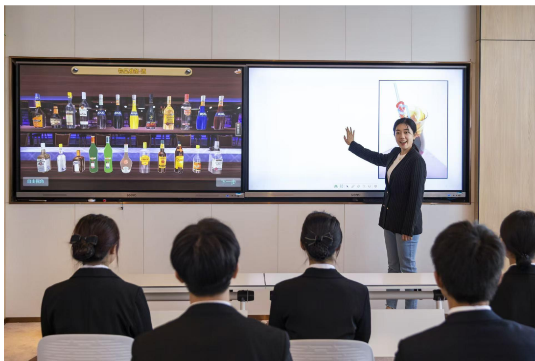
图 3 海尔洲际酒店参与建设校内实训基地