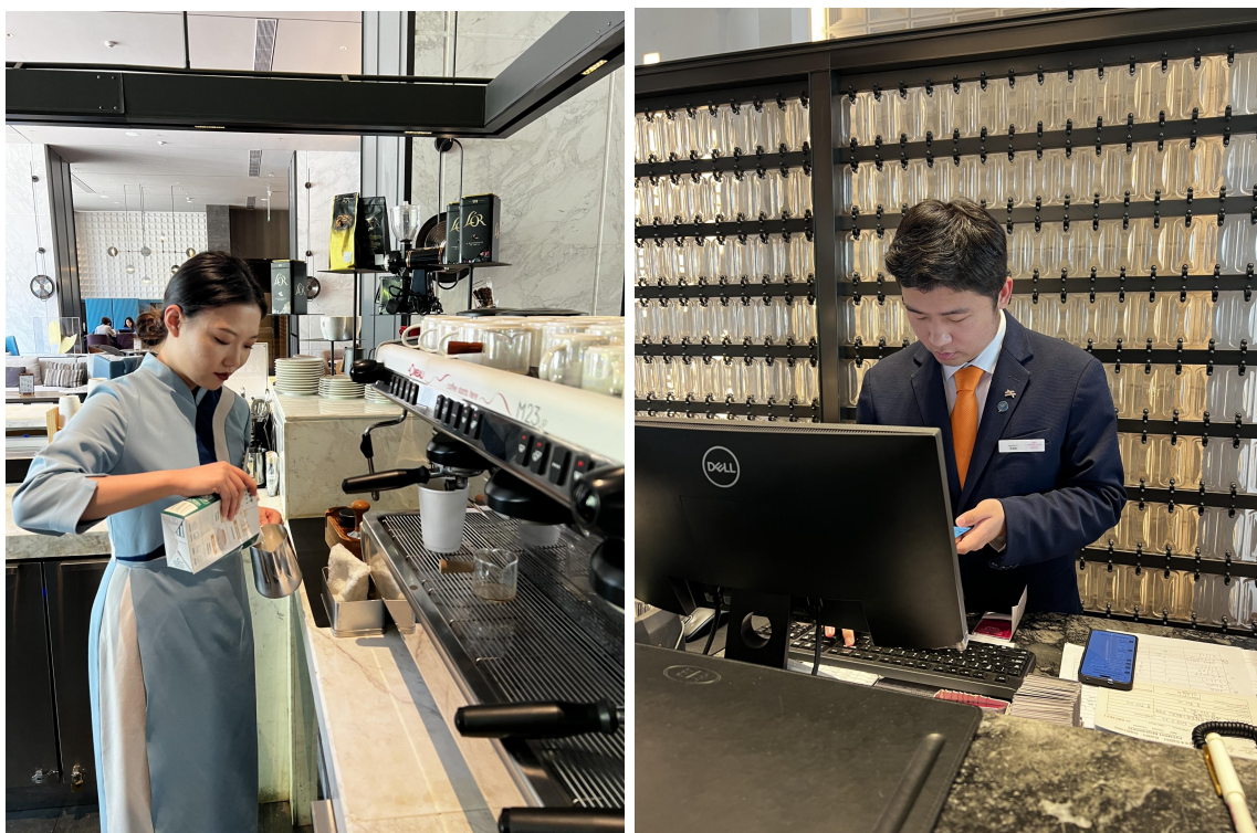
图 2 海尔洲际酒店开展真实运营场景“企业课堂”教学