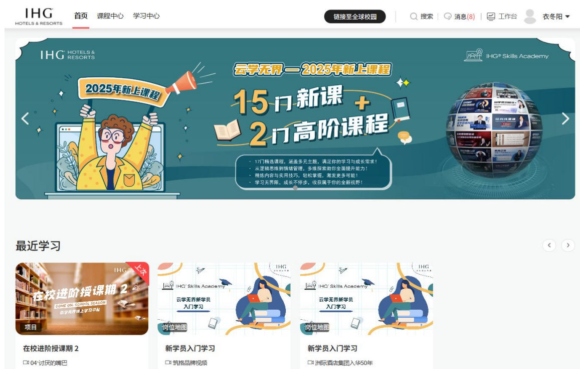
图 1 “云学无界”数字化培训平台