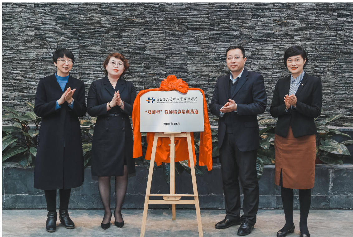
图 11 海尔洲际酒店与学校共建双师型教师培养培训基地

企双方以“双师型教师培养培训基地”为平台，依托企业酒店场地和合作院校实训基地，面向区域职业院校、酒店行业中高层管理者及技术骨干，开展数字化运营、收益管理、卓越服务等专题培训，2025 年度累计培训超 4000 人次，为合作院校定向服务区域产业发展提供智力支持保障。