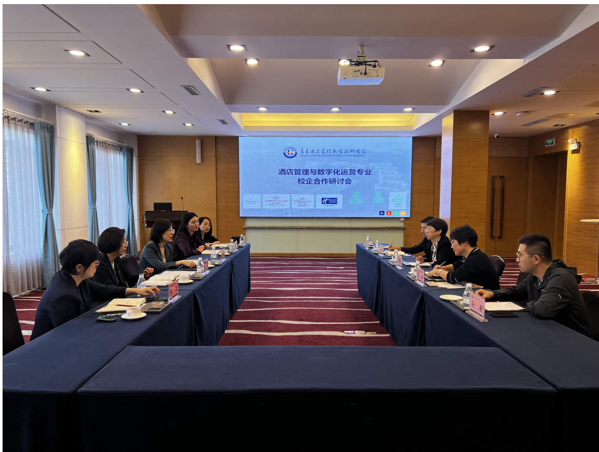
图 10 海尔洲际酒店参与学校人才培养方案研讨

企业结合行业数字化转型趋势与企业发展需求，参与制定酒店管理与数字化运营专业人才培养方案，倡导“数字化运营能力、国际化服务能力、精细化管理能力”的核心培养目标，优化课程体系与实践实训环节，确保人才培养方案的科学性与实用性。