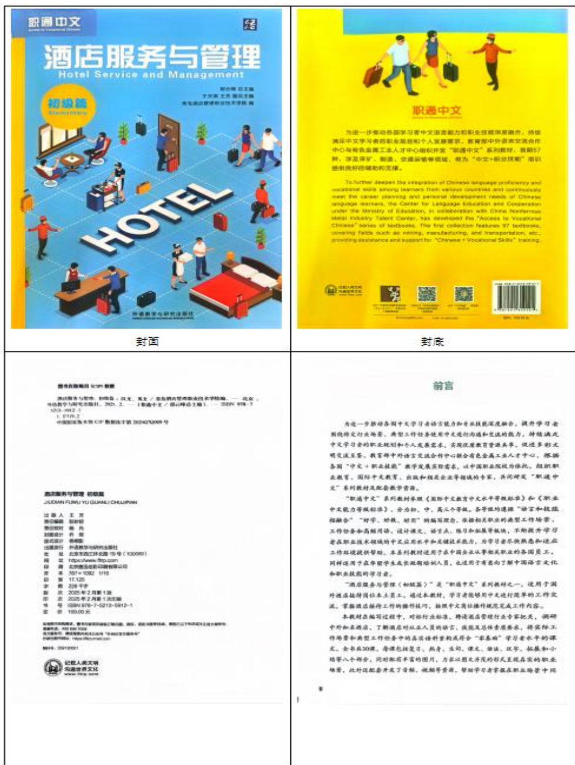
图 12 校企联合开发“职通中文”系列教材《酒店服务与管理》

文教育中文+职业技能标准》，面向各国中文学习者与在华企业员工，培养其职业场景中的中文应用能力与酒店服务技能，为企业海外业务拓展储备国际化人才，助力合作院校“中文+职业技能”出海。