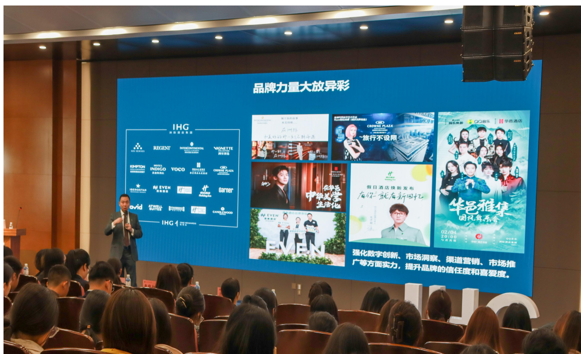
图 4 海尔洲际酒店企业导师入校开展专题讲座