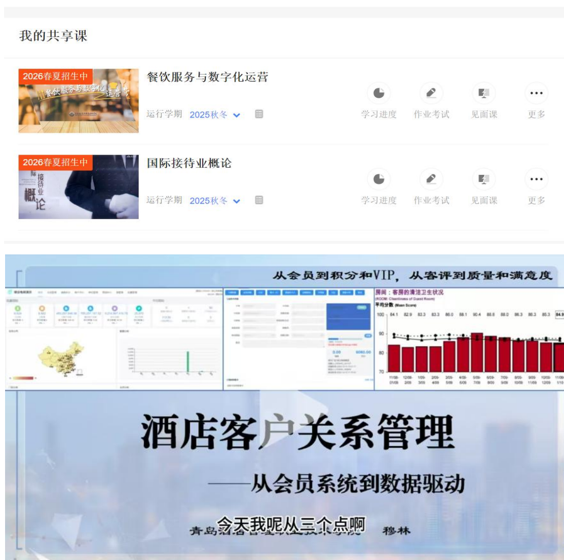
图 7 酒店与学校联合开发在线课程

酒店积极整合行业标准资源与技术力量，与学校共同推进课程与教材建设。双方联合开发了《酒店服务与管理》《餐饮服务与数字化运营》等 3 本教材，其中《酒店服务与管理》纳入“职通中文”系列教材，面向海外中文学习者及在华国际企业员工，推动“中文+职业技能”融合培养，助力国际化人才体系建设。同时，双方还合作建设《国际接待业概论》《客户关系管理》等 4 门核心课程，将企业实践标准与岗位核心能力全面融入教学内容，有效增强了课程与酒店行业实际需求的适配性与前瞻性。