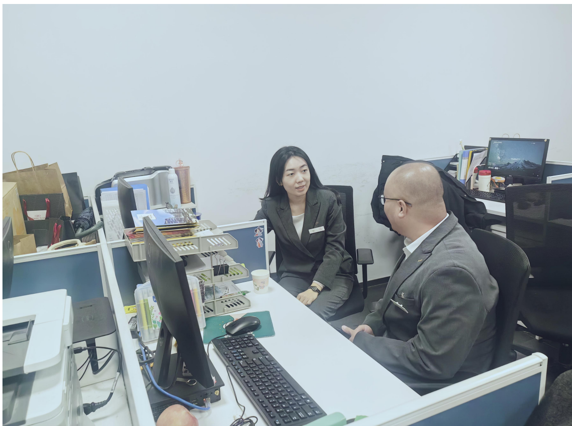
图 6 海尔洲际酒店接收教师企业挂职实践

酒店倡导与学校共育师资队伍，建立长期师资培养机制，在青酒店全部纳入院校定点挂职单位库，一方面，接收学校教师进入企业担任管理岗位实践锻炼，积累一线实战经验；另一方面，接纳新入职教师开展阶段性灵活挂职，帮助新入职教师了解行业、认知行业、熟悉行业，提升其专业素养和岗位实践能力，切实推动院校“双师型”教师培养，实现人才共育、岗位共享、发展共赢。