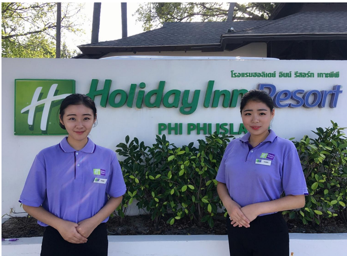
图 13 海尔洲际酒店为学生提供海外酒店实习机会

酒店依托广泛的全球酒店网络，为学生打通海外实习与职业发展的国际通道。集团通过内部推荐机制，优先为学生提供赴海外旗下酒店的实习机会，有效拓宽学生的国际视野，显著提升跨文化沟通与实践能力。同时，企业将国际酒店服务标准与跨文化服务技巧系统融入院校教学内容，推动课程体系与国际行业规范接轨，着力培养具备全球胜任力、能够适应国际化酒店行业需求的高素质专业人才。