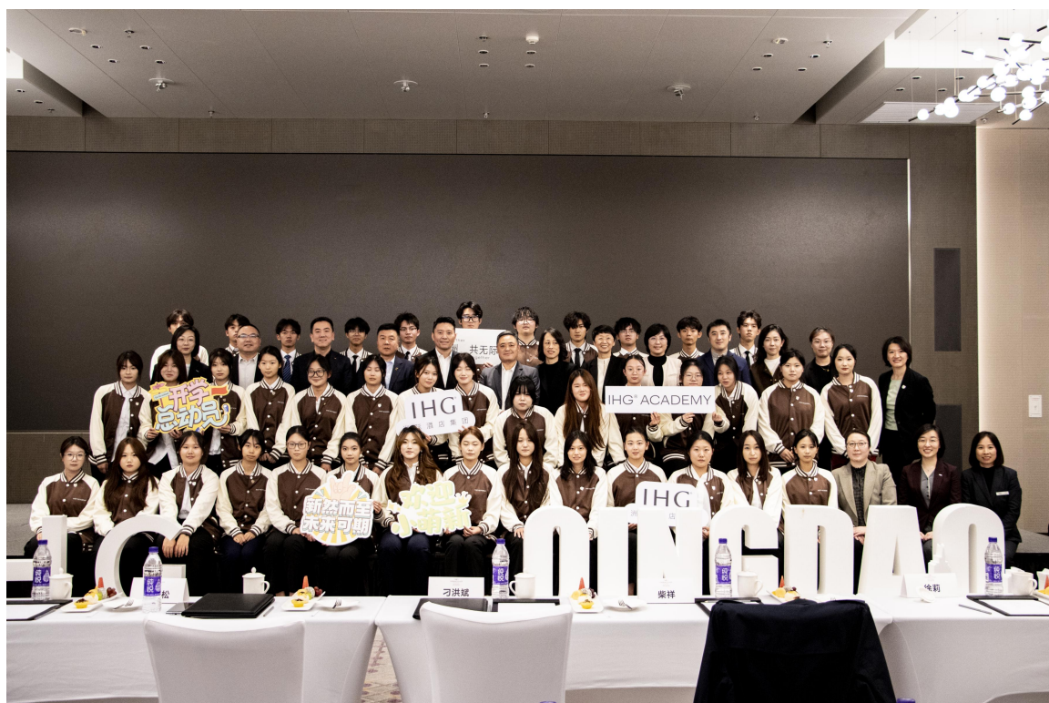
图 5 海尔洲际酒店管理层参与学生活动